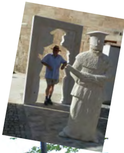
Foto-Impressionen von der Gemeindefreizeit ...