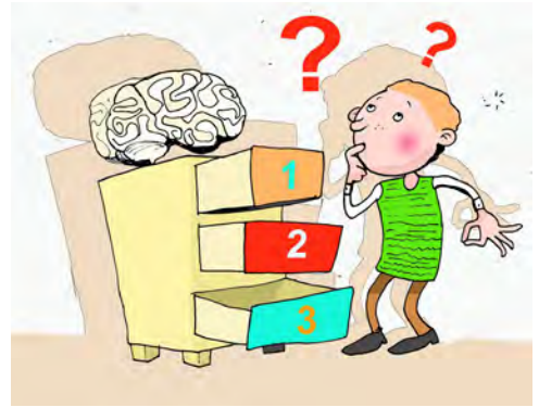
Texte/Illustrationen: Christian Badel

Wenn jemand ein äußerst gutes Gedächtnis hat, sagt man auch: Der hat ein Elefantengedächtnis. Was ein Elefant einmal gelernt hat, vergisst er selten wieder. Sein ausgezeichnetes Gedächtnis ist vor allem die Grundlage für die ausgedehnten Wanderungen, die sich über mehrere Tausend Kilometer erstrecken können.