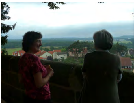
Alle Fotos S. 12-14 (außer Foto Burg Wernfels) von Eckehart Fabarius

Brunhild Beuttenmüller und Eckehart Fabarius